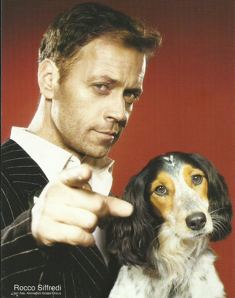
Rocco Siffredi per Ass. Animalisti Italiani Onlus

Sterilizza il tuo cane e il tuo gatto. IL MIGLIOR MODO PER COMBATTERE L'ABBANDONO È LA STERILIZZAZIONE.